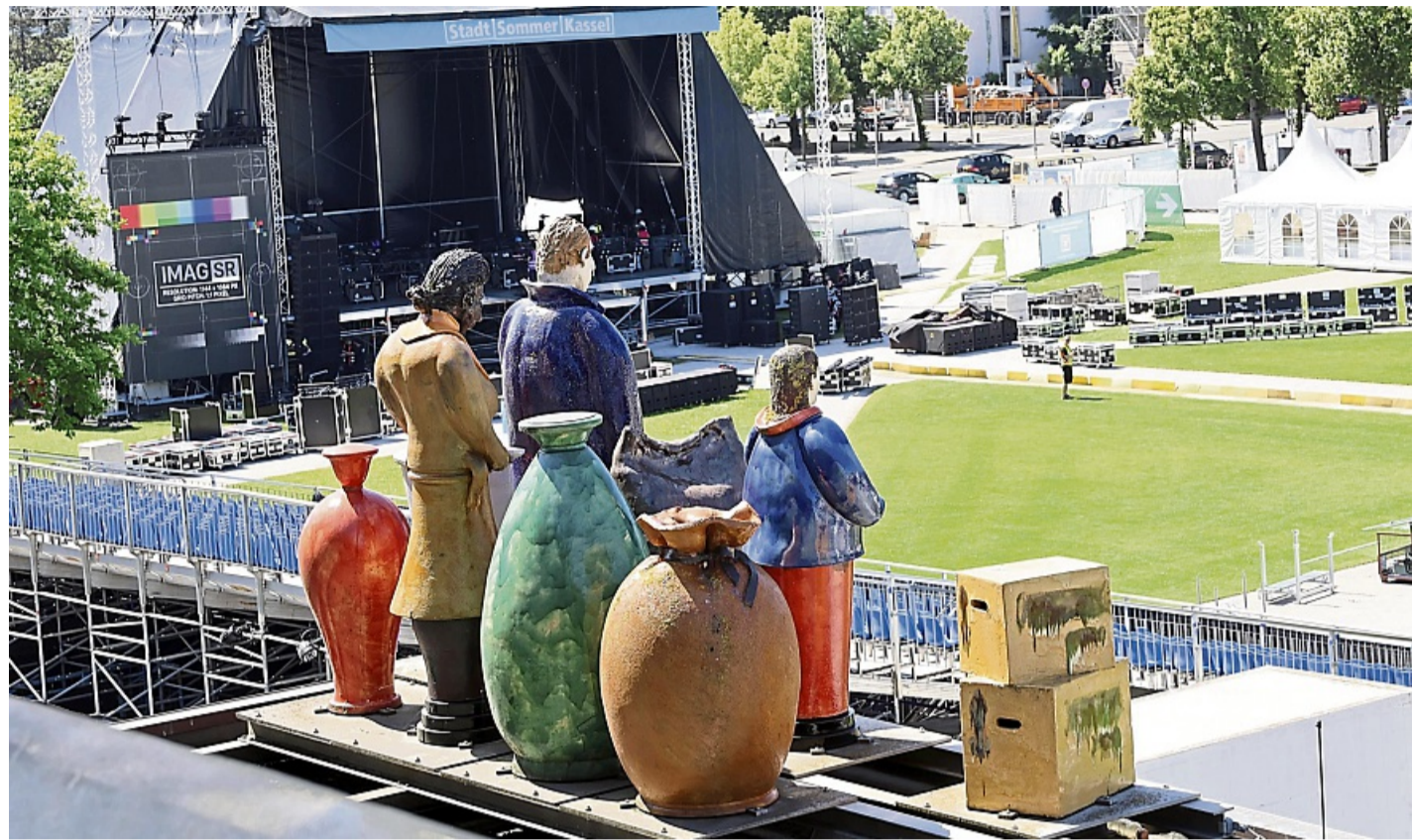
Blick auf das documenta-Kunstwerk „Die Fremden“: Im zweiten Stock wurden Fenster eingezogen. Die Figurengruppe blickt zuletzt auf die Bühne des Stadtsommers.

Am anderen Ende der 2000 Quadratmeter großen Etage residiert unter anderem Tory Lynford, die Direktorin für internationales Fundraising. Dazwischen sieht es ebenso loftartig wie luftig aus. Auf dem neuen Teppich stehen vereinzelt alte Möbel aus dem Ruruhaus. Das ist auch deshalb sinnvoll, weil sich die documenta fifteen in-