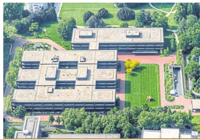
Das ehemalige Bonner Kanzleramt, heute Entwicklungshilfeministerium. Im hinteren Bauteil lag Schmidts Büro