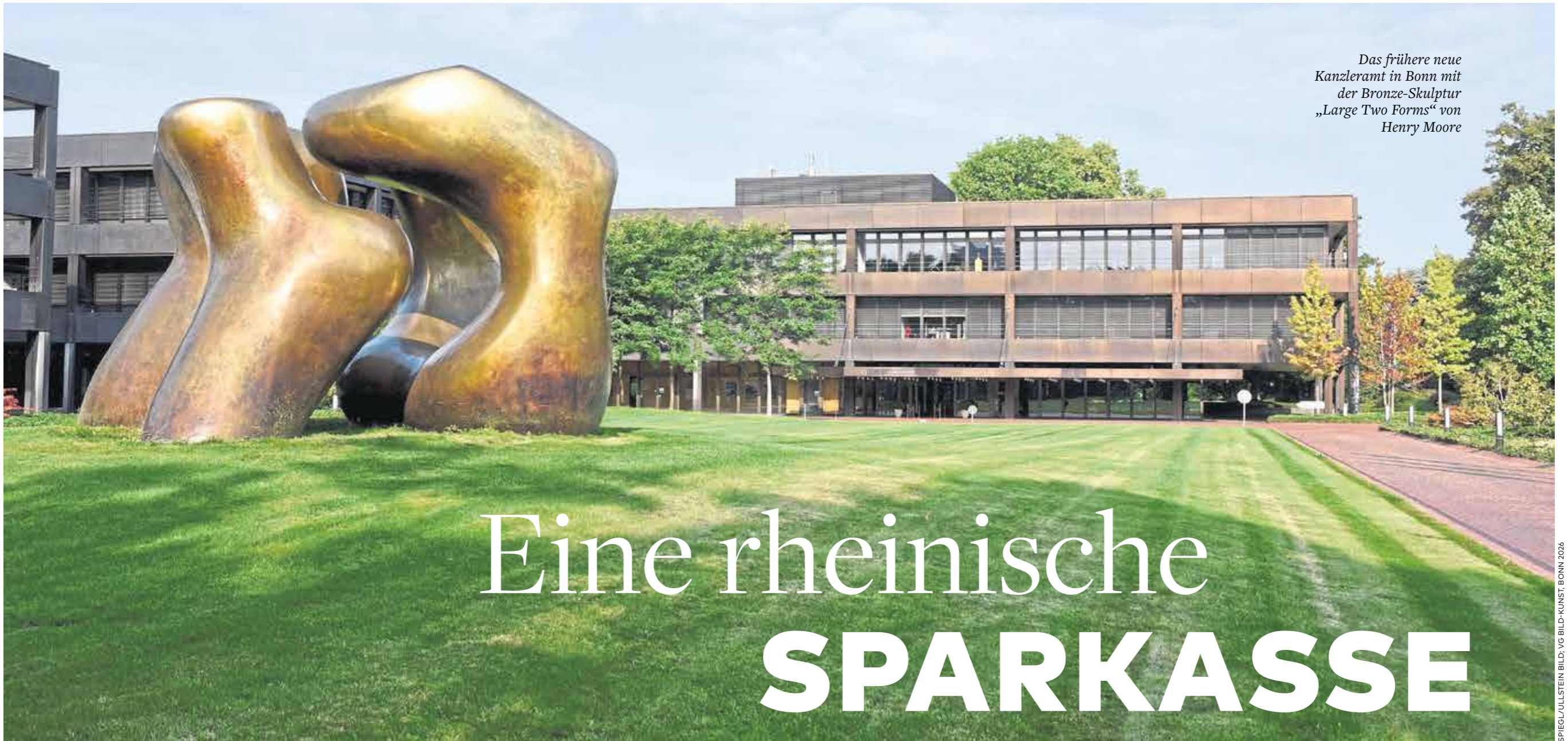
Das frühere neue Kanzleramt in Bonn mit der Bronze-Skulptur „Large Two Forms“ von Henry Moore