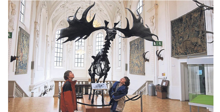
Ex-Kirche mit Riesenhirsch: das Jagd- und Fischereimuseum.

Nicht nur, aber vor allem mit Kindern, ist das Jagd- und Fischereimuseum in der Neuhauser Straße 2 in der ehemaligen Augustinerkirche einen Besuch wert.