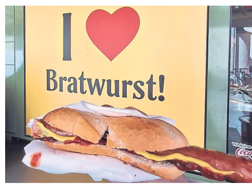
Diesen Rauchzipfel werden Sie lieben! Ft. tse

eine grobkörnigere Rote, gut gewürzt und zart geräuchert. Ein Traum! 4,50 Euro kostet sie hier. Danach gibt's zur Abrundung noch was Süßes, ebenfalls auf die Hand. Kein Geheimtipp, aber ein absolutes Muss: eine Zwetschgennudel vom Café