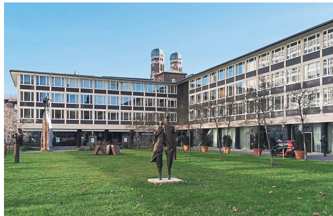
In der Maxburg kann man eine Tasse Kaffee mit Blick auf gute Architektur und Kunst genießen oder einfach nur durchatmen.

Der Innenhof der Neuen Maxburg ist der ideale Platz, um eine Pause einzulegen. Man kann hier durchatmen und in den weiß-blauen Himmel schauen. Auf der Grünfläche gibt es aber auch einiges an Kunst zu sehen, etwa den ziemlich hohen Brunnen mit der Mosesfigur, die Josef Henselmann um 1955 geschaffen hat. Über Sep Rufs formidabile Architektur kann man ohnehin nur ins Schwärmen geraten, dazu gehört freilich auch das Treppenhaus im Justiztrakt. Aber wir wollen draußen bleiben und umrunden die Burg, von der nach den Zerstörungen des Zweiten Weltkriegs nur noch der massive Renaissanceurm übrig geblieben ist.