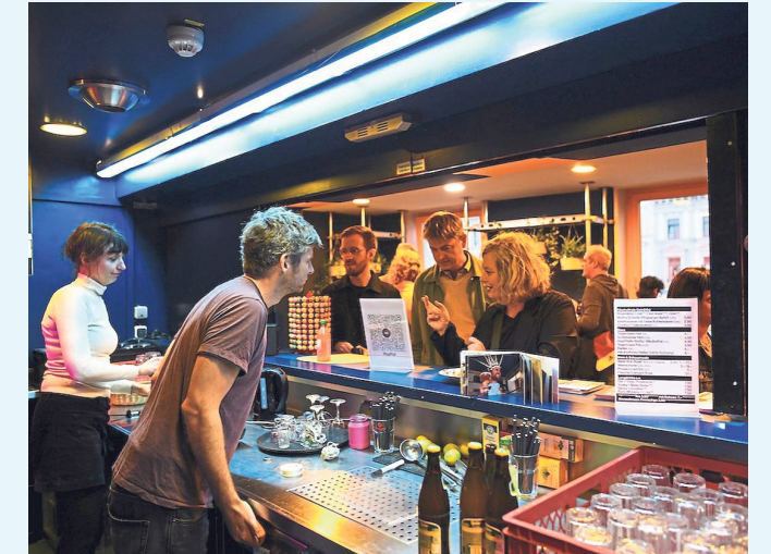
Die Tam Tam Treppenbar in den Kammerspielen ist von Donnerstag bis Samstag geöffnet.

Man denkt es kaum, aber auch wer in der Altstadt etwas unter der Touri-Fallen- und Schicki-Oberfläche unterwegs sein mag, hat dazu viele Möglichkeiten.