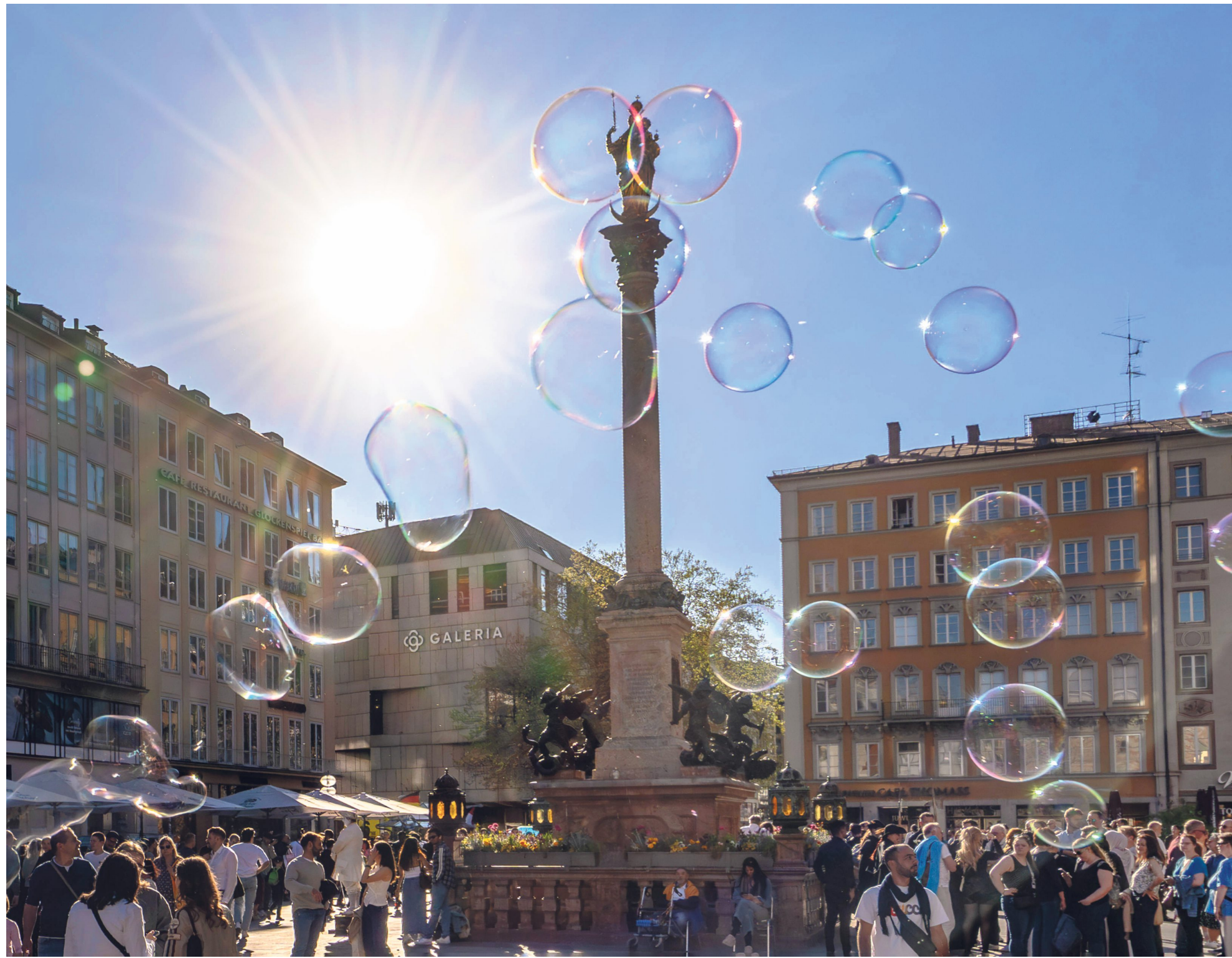
Seifenblasen glitzern in der Abendsonne: Auch an diesem Wochenende ist wieder Sonnenschein angekündigt. Perfekte Bedingungen also für einen Ausflug in die Altstadt.

So oder so: Die Altstadt hat etliches zu bieten und lohnt immer einen Besuch. Die AZ wünscht viel Spaß beim Urlauben in der eigenen Stadt. cm