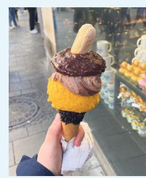
Was eine Eistüte: Die gibt's bei Venchi.

Sonne, Sonne, Sonne und Temperaturen über 20 Grad: Wenn das kein Eis-Wetter ist. Wer mal was Besonderes ausprobieren mag, kann das bei Venchi (Marienplatz 17). Dort wird das Eis klassisch italienisch kunstvoll in die Waffel gespachtelt. Dafür darf man sich eine Waffel-Größe und -Art aussuchen. Obendrauf kommt dann noch ein Keks. Obwohl das Eis nicht ganz günstig ist, ist die Schlange immer lang. Kleine Portion ab 4,60 Euro, in der Gourmetwaffel kostet's 2 Euro mehr, mit Schokoaufstrich oder Streusel noch mal 1,50 Euro extra. cm