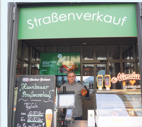
Deftiges auf die Hand: der Straßenverkauf vom Haxnbauer im Tal.

Obacht, liebe Vegetarier und Veganer: Jetzt wird's deftig! Beim Haxnbauer im Tal (Ecke Sternecknerstraße) gibt's nämlich ordentlich was auf die Hand: etwa die Haxn-Semmel (mit Kruste, Kraut, Salat und Soße, 6 Euro). Nix für den kleinen Hunger zwischendurch –