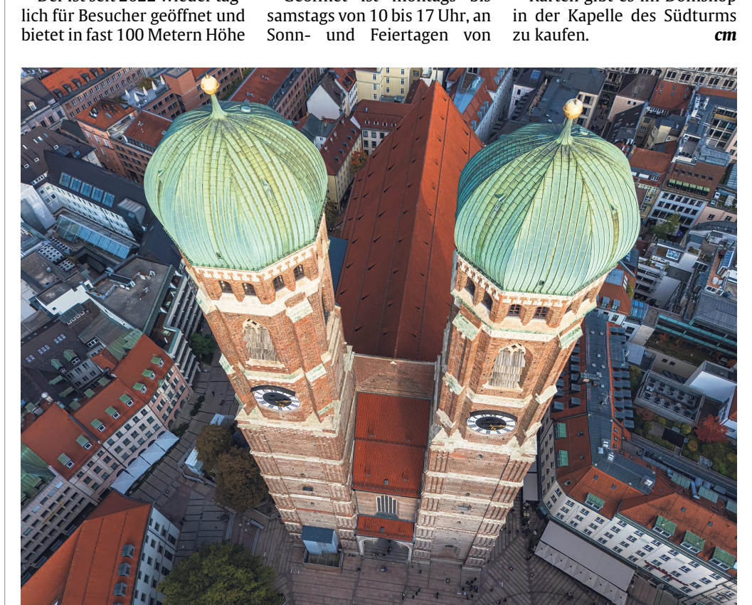
Fast 100 Meter ragen die Türme der Frauenkirche in die Luft: Deshalb bietet sich auch allen, die den Südturm besteigen, ein spektakulärer Ausblick über die Stadt und das Umland.

11.30 Uhr bis 17 Uhr. Der Eintritt kostet für Erwachsene 7,50 Euro, für Kinder und Jugendliche werden 5,50 Euro fällig und Kinder bis einschließlich 6 Jahre steigen kostenlos nach oben. Karten gibt es im Donshop in der Kapelle des Südturms zu kaufen. cm