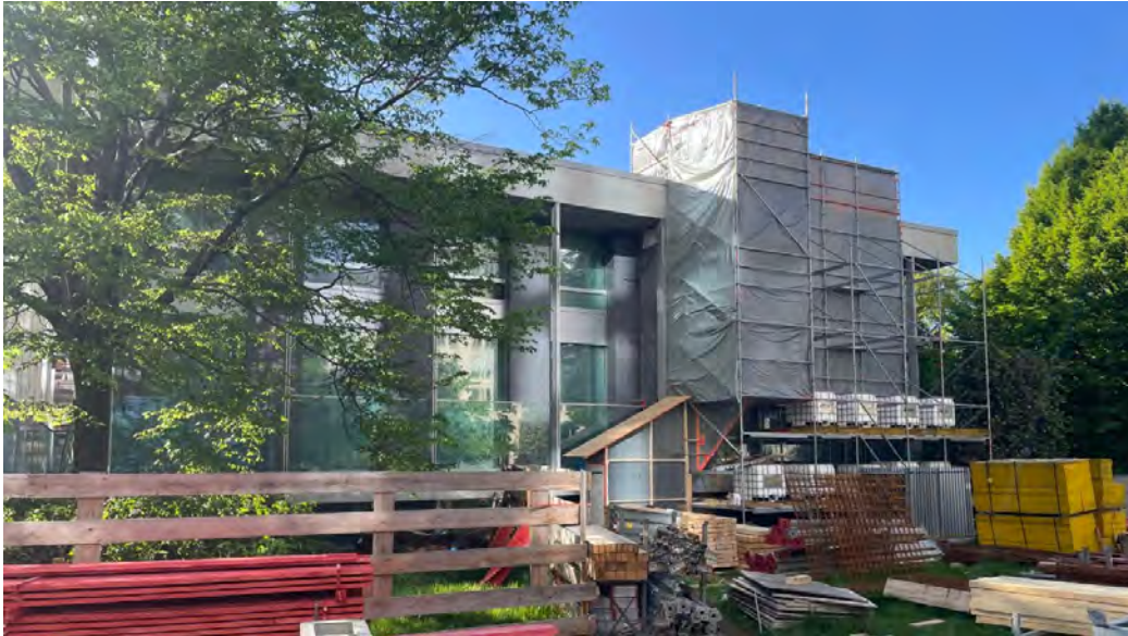
Teil des Gesamtprojekts: Der Flachbau des CENTRAL PARX wird parallel zum Hochhaus saniert. Das Ensemble aus Tower, Studio und Pavillon umfasst künftig rund 23.500 Quadratmeter Bürofläche.