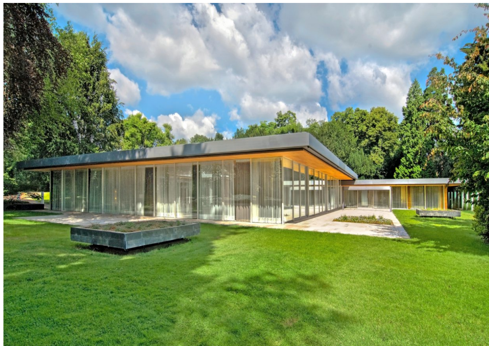
Schöner Wohnen: Der lichtdurchflutete Kanzlerbungalow verzichtet auf ostentativen Luxus.

stellt, ohne eine neue Funktion zu finden. Rettung für das Paradebeispiel der deutschen Nachkriegsmoderne kam schließlich durch die Wüstenrot Stiftung, die den Kanzlerbungalow in ihr Denkmalprogramm für die Revitalisierung herausstechender Bauten der Moderne aufnahm und die Sanierung Ende der 2000er-Jahre unter der Bedingung finanzierte, den Kanzlerbungalow öffentlich zugänglich zu machen. Blicke die Frage, welcher Kanzlerbungalow für die Nachwelt erhalten werden sollte. Für das Empfangsgebäude fiel die Entscheidung, den Originalzustand von 1964 wiederherzustellen, inklusive der ausladenden „5407“-Sofas des amerikanischen Designers Edward Wormley und