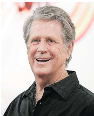
4. Brian Wilson

Er war der Kopf der Strandjungs, der fröhlich-wellenreitenden US-amerikanischen Popkapelle, „The Beach Boys“ aus den 1960er-Jahren. Doch Brian Wilson hatte Größeres im Sinn als seine Brüder. Mit „Smile“ bastelte er an einem bahnbrechenden Werk der Popgeschichte, „ein symphonisches Mosaik“, wie es die „Zeit“ ausdrückte. Wilson versank in Drogen und Depressionen, vollendete sein Werk endlich Anfang des 21. Jahrhunderts, erlebte noch die Begeisterung für seinen schöpferischen Geist.