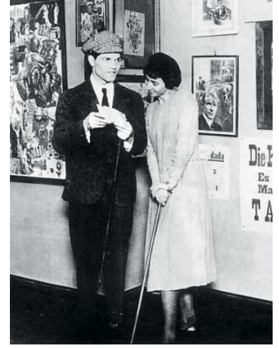
10. Raoul Hausmann (mit H. Höch)

Kanzlerbungalow in Bonn, erbaut für Ludwig Erhard, sollte Ausdruck sein für Demokratie, Offenheit und Klarheit des neuen Deutschlands. Auch das Germanische Nationalmuseum in Nürnberg überformte Ruf genial und verwirklichte hier sein Credo von der „schwebenden Leichtigkeit“. Damit seine Wohngebäude auch innen stimmig waren, entwarf er passende Möbel und Lampen bisweilen gleich mit dazu. Sep Ruf liegt auf dem Bergfriedhof von Gmund am Tegernsee begraben.