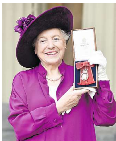
3. Stephanie Shirley

Über das private Leben des griechischen Mathematikers und Ingenieurs ist wenig bekannt. Vermutet wird, dass er nach dem Jahr 62 nach Christus gestorben ist. Heron lehrte in Ägypten am Museion von Alexandria, der neben Rom, bedeutendsten Stadt des Altertums. Überliefert sind von ihm Bücher der Optik, der Mechanik, der Hydraulik und der Messtechnik sowie der Satz des Heron zur Berechnung der Fläche eines Dreiecks. Zu seinen Erfindungen zählt auch die in seinem Werk Pneumatika beschriebene Konstruktion eines Weihwasserautomaten, der als ältester Verkaufsautomat der Welt gilt.