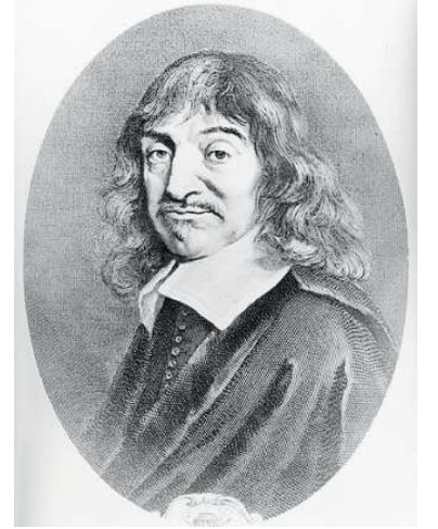
2. René Descartes

Was ist das „Grässliche“ am Sozialismus? Nächtelang habe sie gelesen, um das herauszufinden, schreibt Lily Braun in „Memoiren einer Sozialistin“, ihrem bekanntesten Werk. „Aber ich fand es nicht!“ Für die adlig geborene Preußerin waren Forderungen nach gleichen Rechten für Männer und Frauen, nach freier Entwicklung der Persönlichkeit ohne Fesseln der Rasse, Kaste, des Geschlechts, Vermögens einfach nur: selbstverständlich. Darum trat sie der SPD bei und prägte mit ihren Reden und Schriften die deutsche Frauenbewegung.