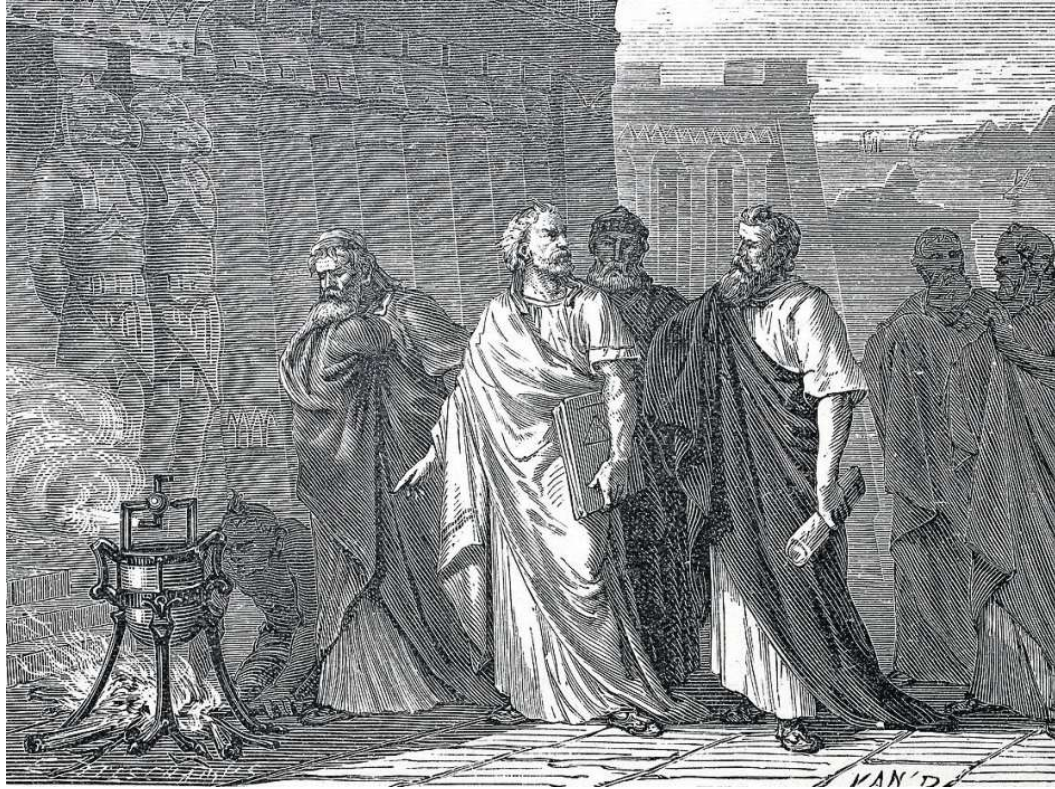
4. Heron von Alexandria

Dem Holocaust war die Dortmunder Jüdin dank des Kindertransports nach England entkommen. Überlebt zu haben, sah Stephanie Shirley als Pflicht, aus ihrem Leben etwas zu machen. 1962 gründete die IT-Pionierin ihre eigene Softwarefirma. In ihrem Unternehmen stellte sie nur Frauen an, vorzugsweise in Teilzeit und im Homeoffice, damit diese Familie und Beruf verbinden konnten. Der Verkauf des Unternehmens machte die Trägerin mehrerer Ehrendokortitel zur drittreichsten Frau Großbritanniens – vorher hatte sie ein Viertel der Anteile an Mitarbeiterinnen verschenkt. Im Alter war die zur Dame Geadelte als großzügige Philanthropin bekannt.