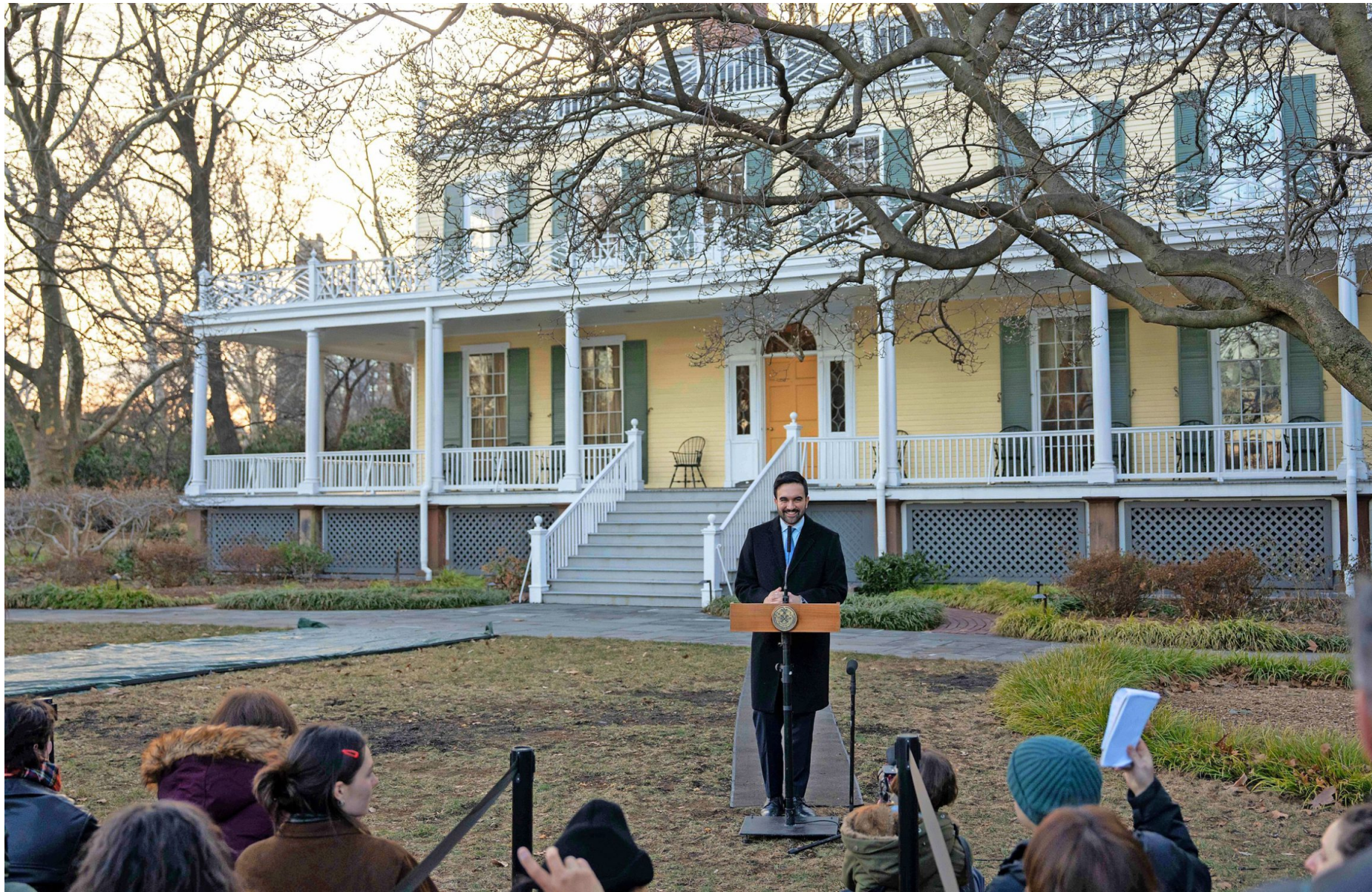
Repräsentativ: New Yorks neues Stadtoberhaupt Zohran Mamdani (links) wohnt jetzt in Gracie Mansion. Deutschen Bundespräsidenten steht die Villa Wurnbach zur Verfügung.