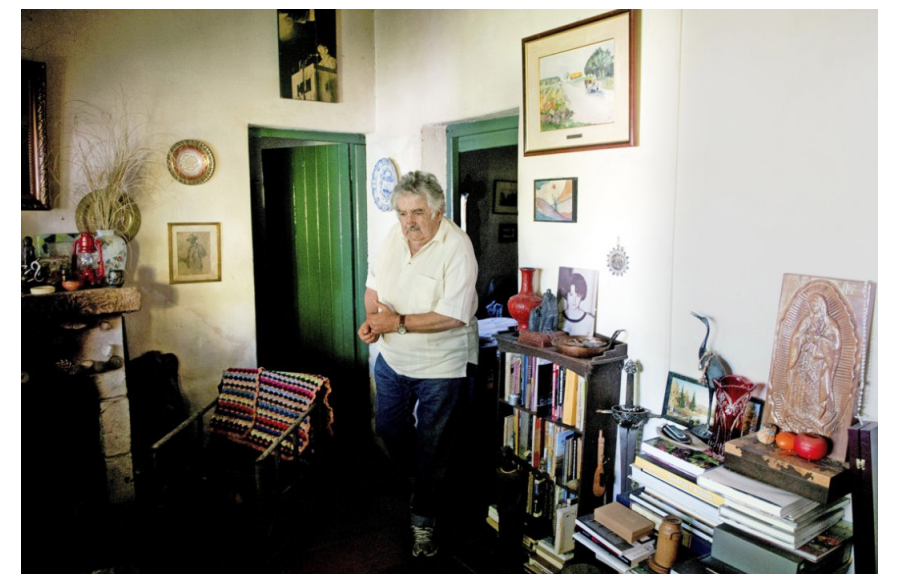
Bescheiden: Uruguays früherer Präsident José Mujica zog es vor, in seiner schlichten Behausung zu bleiben, statt in die Residencia de Suárez umzuziehen.