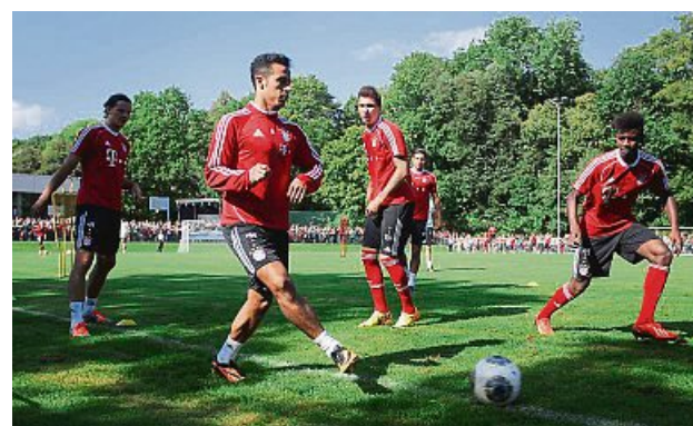
In der Vergangenheit schaute sogar der FC Bayern zum Training vorbei.