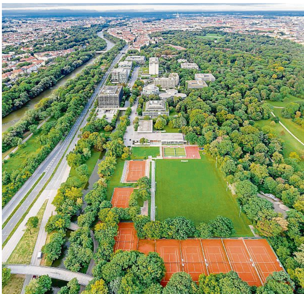
Viel Platz für Sport: Auf der Anlage im Tucherpark gibt es nicht nur ein Fußballfeld, sondern auch jede Menge Tennisplätze.

Der Tucherpark ist ein absolutes Filetstück der Stadt. Ab 1969 hatte die Bayerische Vereinsbank (heute Hypovereinsbank bzw. Unicredit) auf dem 15 Hektar großen Gelände ein Büroareal mit Sportanlage und Hotel (Hilton Munich Park Hotel) nach dem Grundplan des Architekten Sep Ruf errichtet. In Spitzenzeiten hatte der Sportverein der Bank bis zu 4000 Mitglieder, denen ein Schwimm-