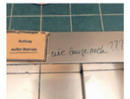
Neben das Schild „Aufzug außer Betrieb“ hat ein Mieter „Wie lange noch???“ geschrieben.