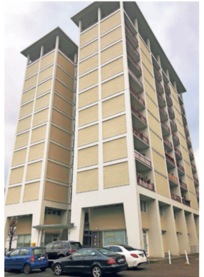
Das Hicog-Hochhaus in Pennenfeld hat elf Wohnetagen und stammt aus dem Jahr 1951.

„Wenn ich auf meine Nebenkostenabrechnung schaue und dort die Kosten für die Gartenanlagen sehe, frage ich mich, wo das Geld bleibt“, kritisiert der Anwalt. Seit der Hausmeister in Rente gegangen ist, gebe