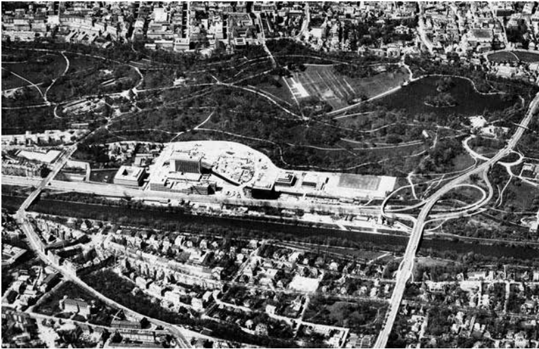
Abb. 2: Eine Insel im Grünen. Das Tivoligelände mit Technischen Zentrum der Bayerischen Vereinsbank, im Bau befindlichem weiterem Verwaltungsgebäude, Hotel München Hilton, IBM-Bauten und Sportzentrum der Bayerischen Vereinsbank. Abb. in: Tivoli. Die Mühle am Englischen Garten, Jubiläumsschrift, München 1973, S. 93

galow in Bonn (1964) oder die locker angeordneten gläsernen Pavillons 1958 auf der Weltausstellung in Brüssel, die er mit Egon Eiermann entwarf und damit ein weltoffenes neues Deutschland zeigte.