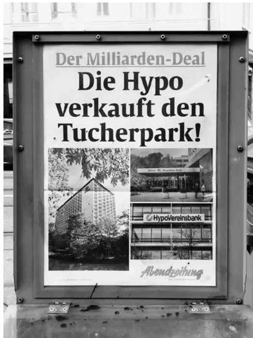
Abb. 6: »Der Milliarden-Deal. Die Hypo verkauft den Tucherpark!«, Abendzeitung vom 4. 12. 2019

Anfang Dezember 2019 wurde mit dem Verkauf des Münchner Büroquartiers »Am Tucherpark« an die Commerz Real und den Projektentwickler Hines einer der größten Finanzdeals von Gewerbeimmobilien in der Geschichte der Bundesrepublik bekannt. Wie den Medienberichten zu entnehmen ist, soll das 15 Hektar große, unter Landschafts- und Ensembleschutz stehende Areal nachverdichtet und in den kommenden Jahren weiterentwickelt werden (Abb. 6). Im Vorfeld hatten die Eigner, die TIVOLI Grundstücks AG und die HypoVereinsbank, eine Potenzialanalyse beauftragt, mit dem Ergebnis, dass durch eine Nachverdichtung die Bruttogeschossfläche von 164.000 Quadratmeter um bis zu 52,4 Prozent auf 210.000 bis 250.000 Quadratmeter erhöht werden könnte. 5