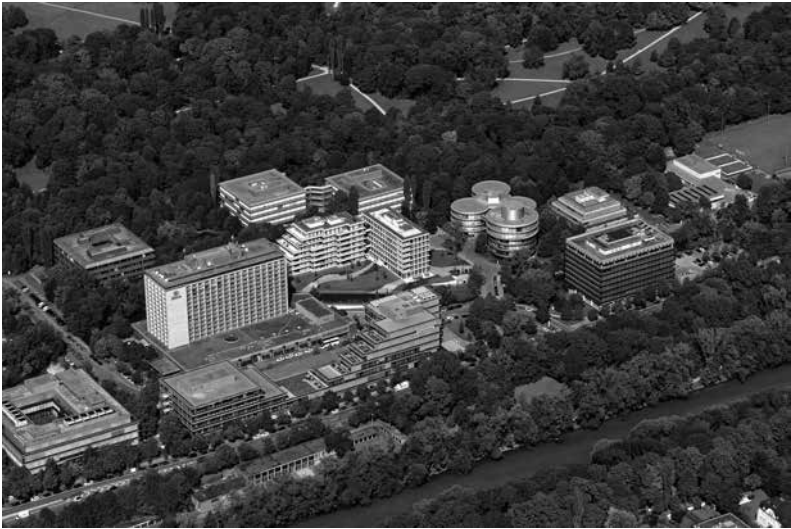
Abb. 5: Am Tucherpark, 9.9.2016 (Luftaufnahme)

figur des mit Sep Ruf eng befreundeten Bildhauers Fritz Koenig, der für die Brüsseler Weltausstellung die »Maternitas« geschaffen hatte, die Ruf dann später im Garten des Bonner Kanzlerbungalows aufstellen ließ.