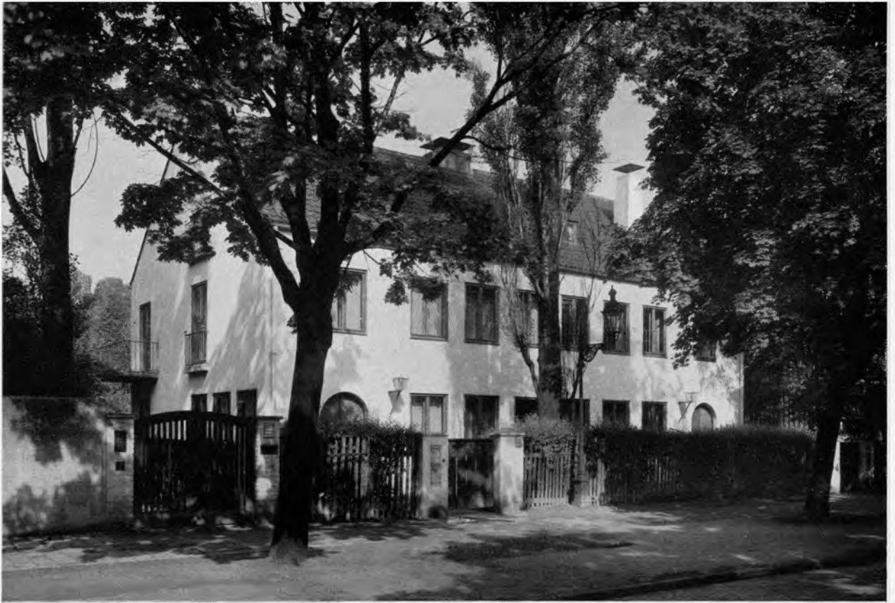
Haus in der Renatastraße, München-Nymphenburg. Unten: Grundrisse und Schnitt