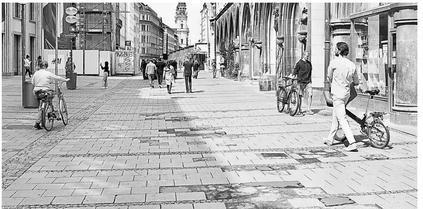
Nicht viel los: Die Weinstraße auf einem Foto aus diesem Jahr.