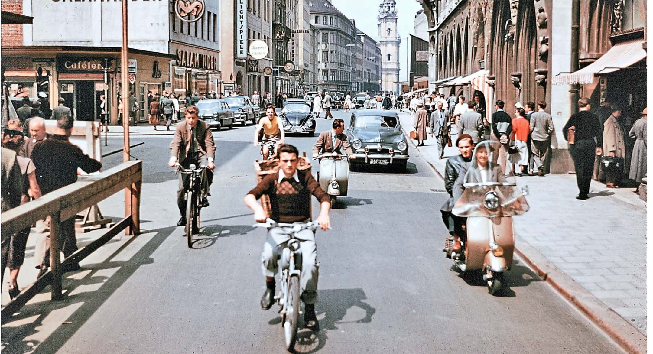
Da ist was los! Blick über die Weinstraße Richtung Theatinerkirche im Jahr 1955.