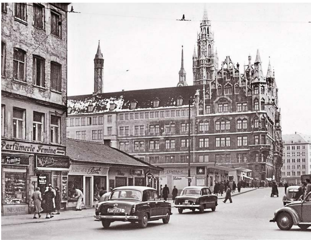
Der Marienhof kurz nach dem Krieg: Behelfsbauten prägen das Bild – bald werden sie abgeräumt.