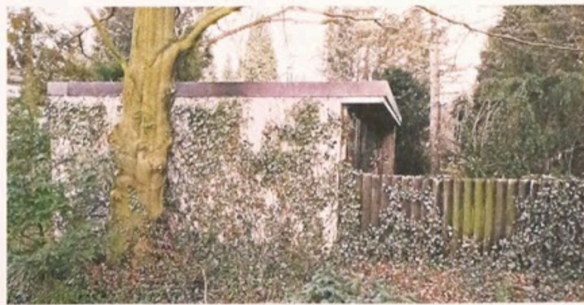
Hätte auch in Kalifornien stehen können: Der Flachdach-Bungalow von Paul Schneider-Esleben für die Familie Riedel in Haan-Gruiten. Er hat ihn Anfang der 1950er Jahre entworfen.

Im Bonner Kanzlerbungalow begegneten sich Politiker aus der ganzen Welt wortwörtlich auf einer Ebene. Dennoch traf Ludwig Erhards Bungalow auf deutliche Kritik in der Bevölkerung und auch auf die nachfolgende Bundeskanzler, die teilweise nicht einmal in dem modernen Gebäude wohnen wollten. Einige gestalteten den Innenraum so um, dass er ihrem persönlichen Empfinden nach