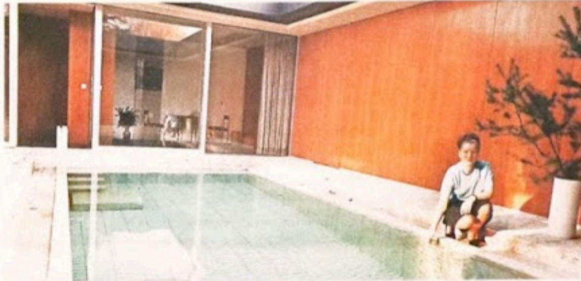
Die Haushälterin von Bundeskanzler Ludwig Erhard prüft am 27. April 1971 die Wassertemperatur des Schwimmbeckens im Kanzlerbungalow.

ten, eleganten Flachdach-Bungalow auch architektonisch seinen Glauben an die Demokratie und seine gute Beziehungen zu Amerika zu demonstrieren. Denn kaum eine Gebäudeform stand mehr für den Begriff der Freiheit und der Individualität des Einzelnen als der Bungalow in all seiner Klarheit und Einfachheit und mit seinen Ursprüngen, die tief in der nordamerikanischen Kultur verwurzelt sind. Der Kanzlerbungalow sollte ein demokratisches, modernes Deutschland repräsentieren, in die Zukunft weisen und gleichzeitig an die Ideale der Weimarer Republik anknüpfen, architektonisch wie symbolisch. Architekten wie Mies van der Rohe und Walter Gropius waren nach der Schließung des Bauhauses in Dessau (1932) und in Berlin (1933) nach Amerika ausgewandert und hatten dort in den folgenden Jahren ihre Ideen verfeinert. Die beinahe vollkommene Transparenz des Kanzlerbungalows kann man sicherlich als Symbol deuten, ganz offensichtlich ist jedoch Sep Rufs Bezug auf Mies van der Rohes Pavillon, mit dem sich Deutschland 1929 auf der Weltausstellung in Barcelona präsentierte, auf das Glass House (1949) des US-amerikanischen Architekten Philip Johnson und auf die Bungalows des sogenannten „Case Study House Programs“, das Ende der 1940er Jahre in Kalifornien lanciert wurde.